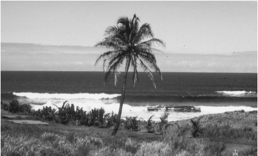
Meine erste Heimat – Maui, Hawaii

Ich war ziemlich allein auf mich gestellt. Mein Herrchen verließ morgens das Haus und kam erst am Abend zurück. Geil, werdet ihr sagen. Sturmfreie Bude den ganzen Tag. Keiner, der sagt: Tue dies, tue das. Ja, es gab Tage, da habe ich das sehr genossen. Aber ich habe mich manchmal auch ziemlich einsam gefühlt. Ein Golden Retriever lebt eben nicht von Futter und einem Dach über dem Kopf. Ich wollte viele Abenteuer gemeinsam mit den Menschen erleben.