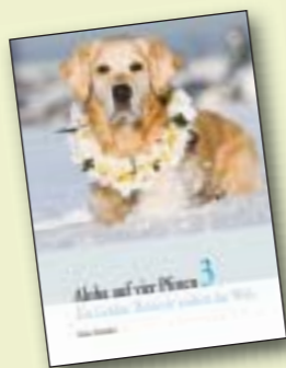
Aloha auf vier Pfoten 3 Ein Golden Retriever erobert die Welt 192 Seiten, 14,8 x 21 cm, broschiert, 114 s/w Abbildungen, Preis: 13,90 Euro. ISBN 13: 978-3-9811146-2-1