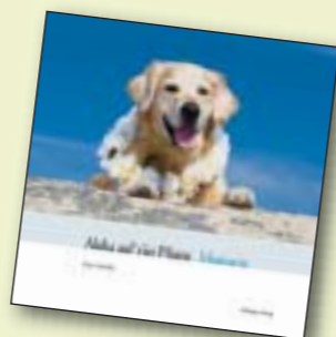
Aloha auf vier Pfoten Momente 96 Seiten, broschiert, 46 Farbfotos, Preis: 11,80 Euro. Subskriptionspreis bis 31.01.2009: 9,80 Euro. ISBN 13: 978-3-9811146-3-8