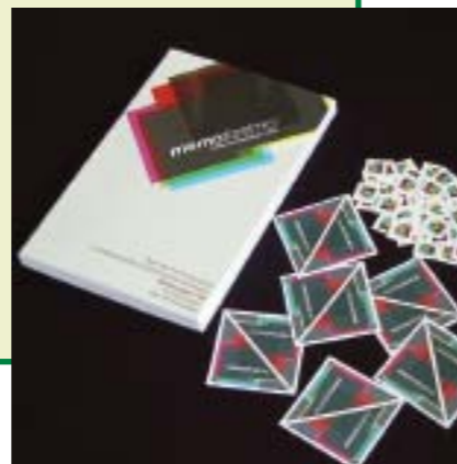
Memotissimo: Gedächtnistraining & Quiz Format: Taschenbuch, 12,5 x 19 cm inkl. 6 Antwortkarten und 60 Spielpunkte. Preis: 9,95 Euro. Bruno Wilbert Verlag ©2008 ISBN: 978-3-9812184-0-4