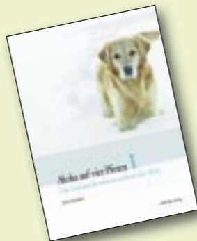
Aloha auf vier Pfoten 1 Ein Golden Retriever erobert die Welt 176 Seiten, 14,8 x 21 cm, broschiert, 45 s/w Abbildungen, Preis: 13,90 Euro. ISBN 13: 978-3-9811146-1-4