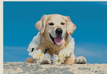
Aloha auf vier Pfoten Momente

Seit 13 Jahren begleitet der Golden Retriever Ipo sein Frauchen und sein Herrchen nun durch den Alltag und auf jede Reise. Der Name Ipo steht in der polynesischen Sprache für „Liebling“ und hinter dem Namen steckt ein Hund mit viel Lebenserfahrung und einer ansteckend guten Laune. Inspiriert von Ipos Lebensfreude entstanden so die Hundeerzählungen „Aloha auf vier Pfoten“ in mittlerweile drei Bänden und überzeugten Hundeliebhaber von Anfang an durch ihre Leichtigkeit.