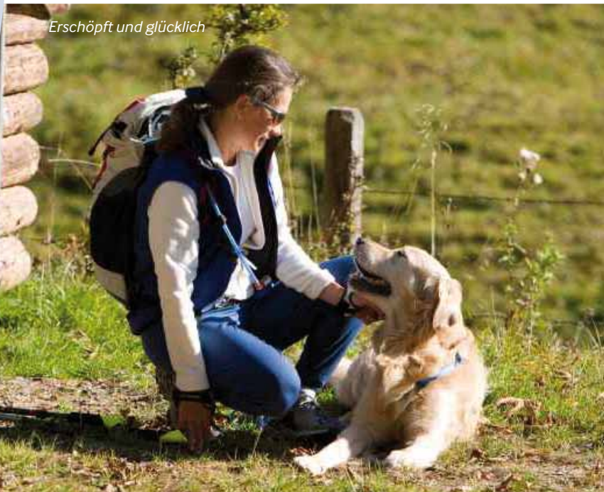
Erschöpft und glücklich