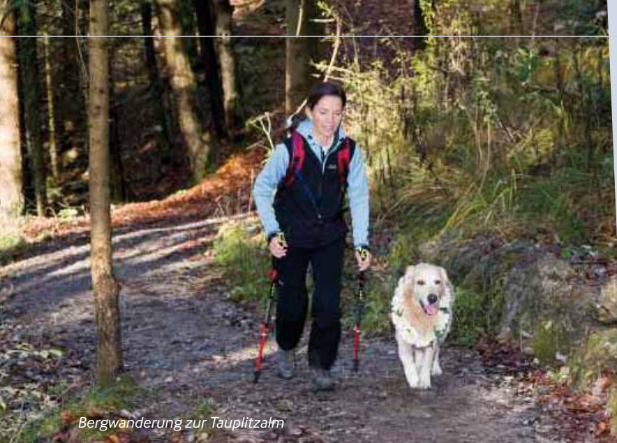
Bergwanderung zur Tauplitzalm