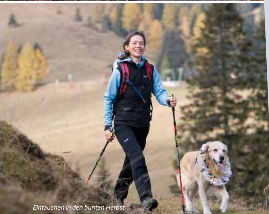
Eintauchen in den bunten Herbst