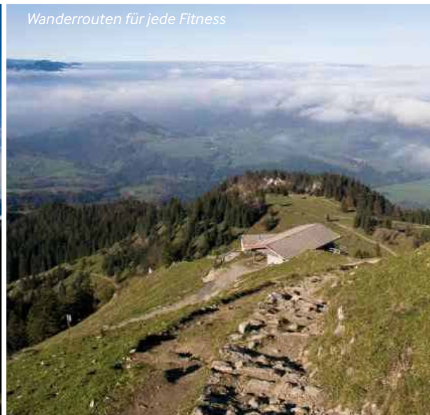
Wanderrouen für jede Fitness