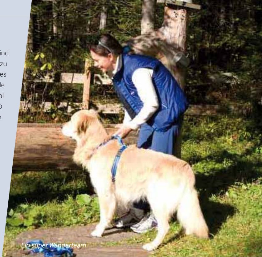
Ein super Wanderteam