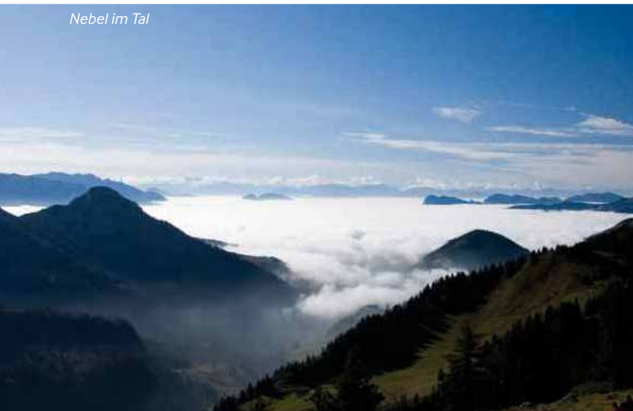
Nebel im Tal