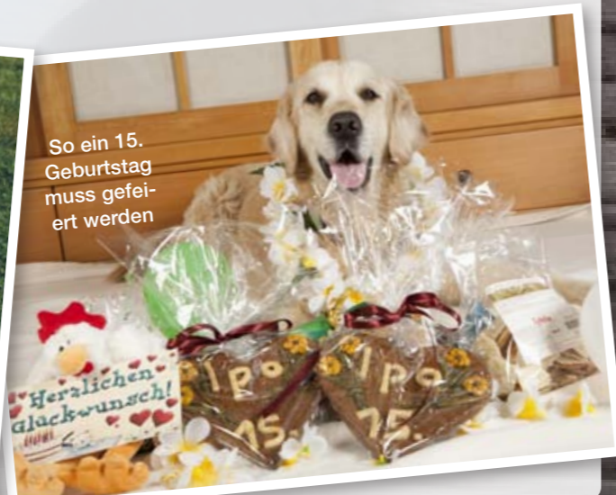
So ein 15. Geburtstag muss gefeiert werden