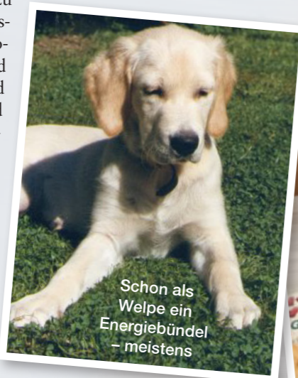
Schon als Welpen ein Energiebündel – meistens

Trotz seiner 15 Jahre braucht er dreimal täglich seinen Auslauf. Zum Glück hat Ipo keinerlei ernsthaften Erkrankungen. Stoffwechsel, Leber und Niere unterstützen wir durch die Gabe homöopathischer Mittel. Nachlassende Muskelkraft an den Hinterläufen und ein leichter Bandscheibenvorfall verlangen nach dosierter, kontrollierter Bewegung statt wildem Umhertollen. Früher hatten wir oft Angst, wenn Ipo in die Jahre kommt. Heute lernen wir diese Zeit als eine der schönsten Episoden kennen. Natürlich stellen wir uns die Frage: „Was kommt nach Ipo?“ Vermutlich wird uns die dankbare Erinnerung an Ipo ein wenig über den Verlust hinwegtrösten. Vielleicht wird es eine Reise nach Hawaii geben in Gedenken an Ipo. Vielleicht ist unser Haus dann aber auch so ruhig und leer, dass wir einen neuen Hund bei uns aufnehmen. Das Leben nach Ipo lässt sich nicht planen. Viel wichtiger ist es, die Zeit bis dahin dankbar zu genießen.